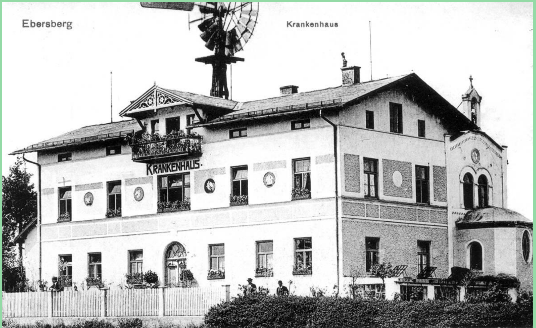
Historische Postkarte. ArchivBild Nr 4